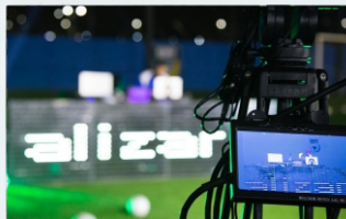
2º Live Solidária Erus - Projeto Socializar BR Arena

Todos os valores e mantimentos foram revertidos para ONG' s que prestam serviço em comunidades carentes de São Paulo.