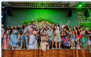
Festa de Confraternização Faro Beach Club