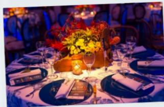
Jantar de Encerramento Casa da Fazenda Morumbi