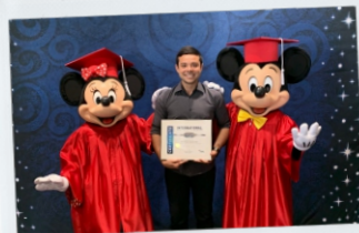
Orlando, EUA Treinamento e Capacitação de Equipes