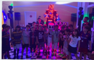
Festa de Confraternização Morumbi, SP