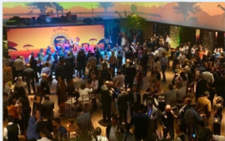
Lançamento de Campanha Casa Bisutti