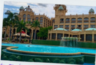
Sun City, África do Sul Campanha de Vendas