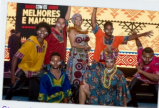
Convenção de Vendas Hotel Fazenda Dona Carolina