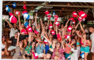
Festa de Fim de Ano Sítio Você e Eu