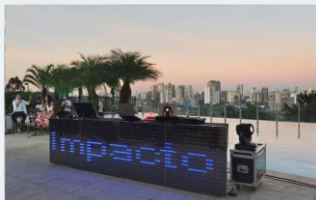
1º Live Solidária Erus - Projeto Socializar Morumbi, SP

Live 100% solidária, com Line-Up completo de shows e efeitos pirotécnicos, realizada no Dia dos Namorados e viabilizada por meio de patrocínios de clientes, artistas e empresas parceiras.