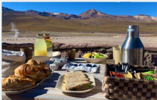
Deserto do Atacama, Chile Viagem de Incentivo e Visita Técnica