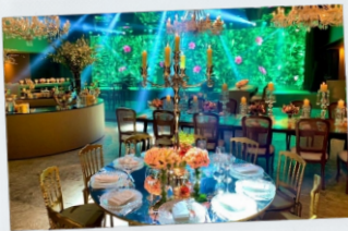
Evento com Projeção Mapeada São Paulo, SP