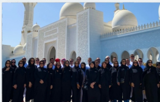
Abu Dhabi, Emirados Árabes Campanha de Incentivo