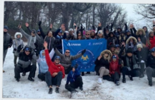
Bariloche, Argentina Premiação de Vendas