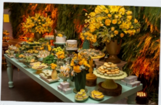
Festa de Aniversário de 50 anos Casa Manioca